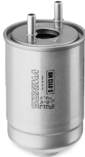
SOFIMA S 4113 NR